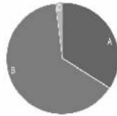
1. 对于贫困山区捐赠“爆仓”,你怎么看?

A. 公众公益爱心集体式体现; 34% B. 盲捐不仅造成受助单位接收压力,还形成资源浪费; 64% C. 为捐赠; 5%