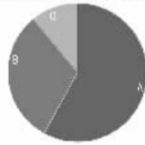
4. 公共场所应设立“母乳喂养室”或公共、半公共哺乳室,方便妈妈喂奶: 58% 3. 应设置相关法律法规,保护哺乳母亲的权益: 31% 2. 应加强社会公众舆论宣传,培养公共自觉意识: 11%