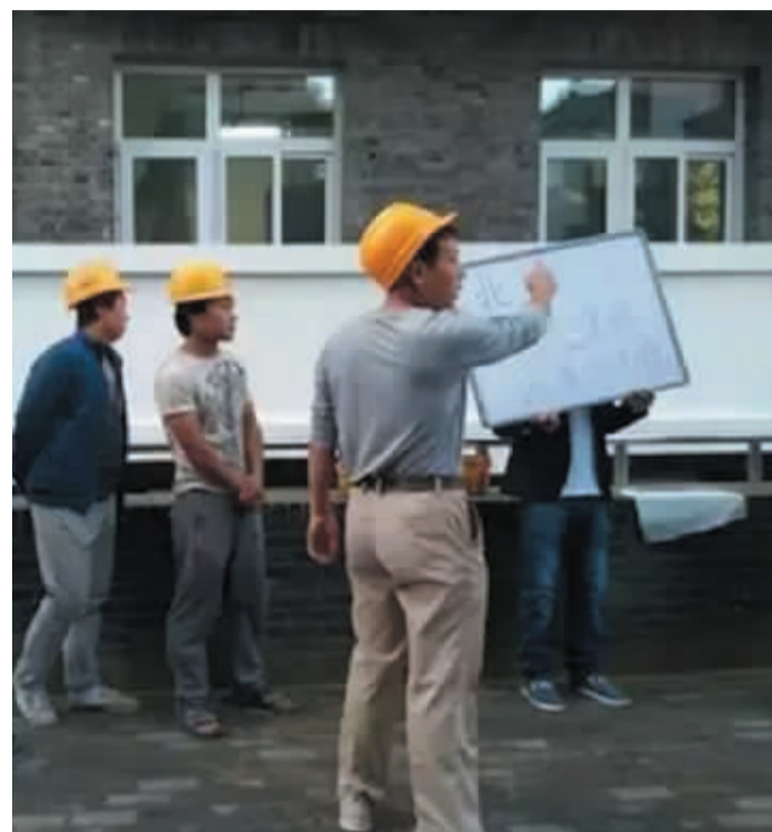
9月下旬,北大校园内建筑工人讨薪,引起北大学子对工人问题的关注。

这里的工友之家全称北京工友之家文化发展中心,是一家致力于服务打工者群体的社会、文化、教育、权益维护及其生活状况的促进与改善的民非机构,