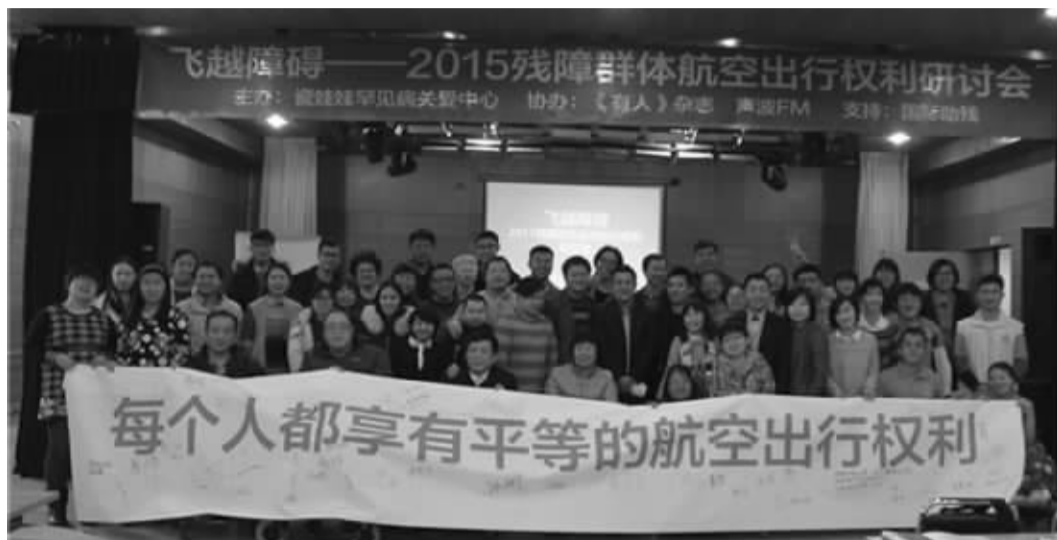
瓷娃娃乘机事件引发了航空业无障碍建设的讨论

司票务信息服务无障碍测试报告》,他的团队测试了南航、东航、海航、国航四大公司的网页、IOS和Android版上的票务信息客户端,其中,只有东航有相关法规规定的特殊申请入口,国航app针对视障人士的无障碍化程度最好,此外,大多网页、app客户端在诸多细节上对读屏软件不友善、存在障碍。他同时指出,信息无障碍化不只利于视障群体,也包括老人、心智障碍者等,是所有人都应该共同推进的目标。