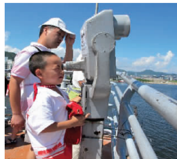
中华社会救助基金会组织农民工子弟参观航母

中华社会救助基金会 2014 年的筹款总额为 6000 万元,而 2015 年所拟定的筹款目标为 9000 万元,截至 2015 年 12 月 31 日共筹款 1.5 亿元,超年初计划 60%。