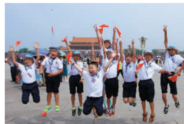
参加 2015 中国社会福利基金会鸿基金爱的背包“萤火虫之旅”夏令营的孩子们。众多的基金是基金会筹款的重要力量。