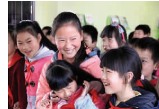
真爱梦想课堂吸引海内外各方来宾关注

2100 万元,占筹款总额的 23%。其中指定捐赠为 7075 万元,占筹款总额的 77%。截至 2015 年 12 月 31 日捐赠支出达到了筹款总额 70%的要求。