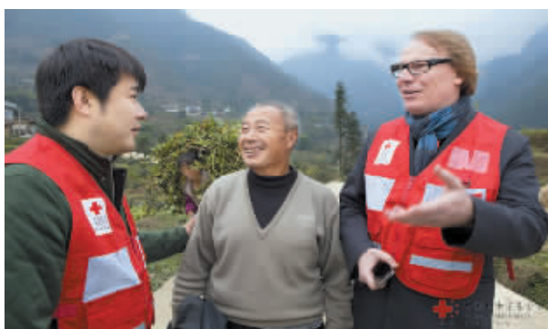
首期“天使之旅-设计师雅安行动”前往雅安

中国红十字基金会 2014 年收入总计 3.47 亿元,其中捐赠收入 1.64 亿元,彩票公益金收入 1.6 亿元,增值收入 0.23 亿元;总支出 3.63 亿元。