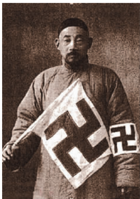
手执会旗的红卍字会员

由上可知,以北京地区为例,民国时期诸卍字会的产生具有深刻的社会与文化根源,它们是近代西风东渐背景下中西慈善文化交融的产物,打上了深厚的时代烙印。最后需要指出的是,“卍”是相传已久的一种符咒、护符或宗教标志,寓意吉祥。今天,尽管诸卍字会已退出历史舞台,但其历史功绩不应湮没无声,它们留下的经验教训值得认真汲取和珍视。同时,诸卍字会的发展脉络及其相互关系,诸卍字会与其他慈善组织(例如红十字会)的关系,以及它们与近代中国社会变迁的深刻内在关联,仍需进一步挖掘和深入思考。