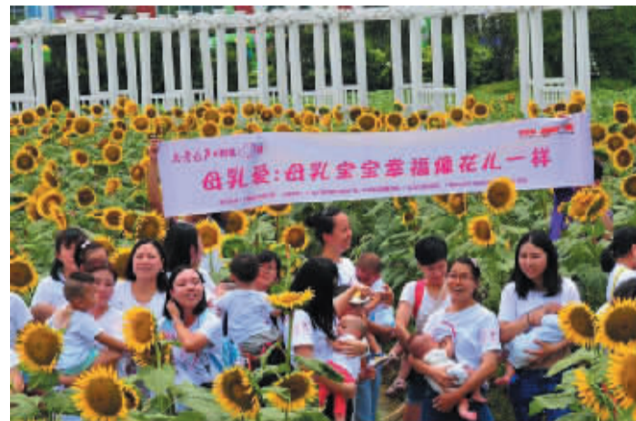
8月1日,母乳爱志愿服务队等在广州组织了“母乳快闪”活动。

2016年,在北京京妍公益基金会的支持下,母乳爱志愿服务队在南京落地,并且和协和医院合作,筹建北京市第一家公立医院母乳库。“母乳库的建设需要很多设备、耗材,这都会产生很多费