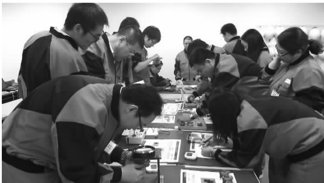
2015年11月,中国仪器仪表行业协会和“纪念苏天·横河仪器仪表人才发展基金会”共同组织学员赴日本横河电机学习。这是基金会的主要项目。

“这些年,基金会从来没有任何捐赠收入,但是项目每年持续开展,所以资金越来越少,也