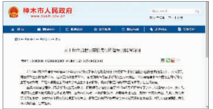
神木市政府的情况说明(网络截图)