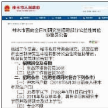
已删除的神木招聘公告

山东省菏泽市政府相关工作人员告诉《公益时报》记者:“公益性岗位在一定程度上为弱势群体提供了经济上的帮助,2018年脱贫标准是在医疗、教育、住房、饮水有保证的情况下,每人每年稳定持续收入不低于3200元,所以在政策标准上公益性岗位确实能使部分群众脱贫‘摘帽’。”