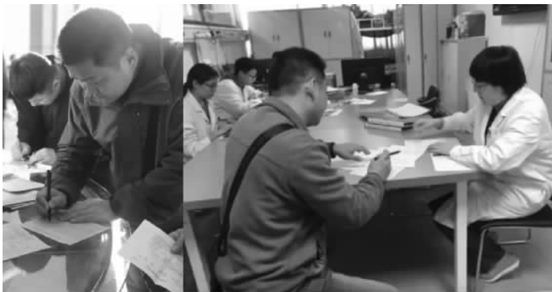
基金会为服务对象办理就医担保

实际上老人需要的是在他们自身没有赡养人或是赡养人不具备赡养能力的情况下,能有一整套的、系统化的方案来解决他们的养老问题。整个养老解决方案需要考虑三个步骤的考虑:第一步是解决确权、监护和风